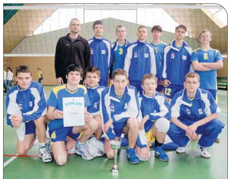
Najlepsi siatkarze wśród gimnazjalistów powiatu legionowskiego w 2009 r.