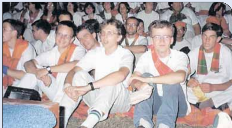
Międzynarodowy Chór XII Światowych Dni Młodzieży w Paryżu 1997 rok

Gdy w 1997 roku u progu wejścia w dorosłe życie, uczestniczyłam w Światowych Dniach Młodzieży we Francji w Paryżu, otoczona setkami tysięcy młodych ludzi z ponad 150 krajów świata, osobiście doświadczyłam wielkości Jana Pawła II. Biała postać pielgrzyma porwijającego tłumy młodych ludzi na zawsze pozostanie w mojej pamięci. Odpowiedzi na nurtujące nas pytania, siła i moc przesłania Słowa Bożego sprawiły, że wracaliśmy do naszych ojczyzn, domów, społeczności – umocnieni, bogatsi, uduchowieni z rozeznaną drogą życiową. Choć różnił nas kolor skóry, języki w których mówiliśmy, kultury z których się wywodziliśmy, połączyła nas miłość i oddanie Ojca Świętego.