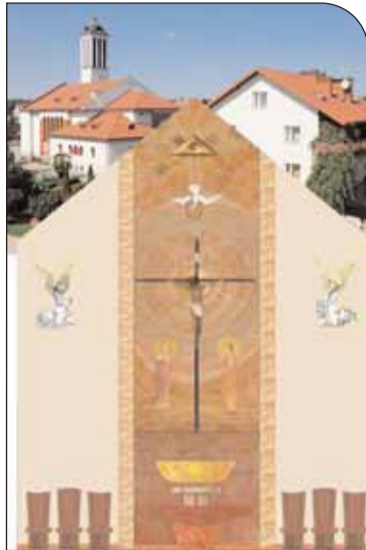
Projekt prezbiterium art. rzeźbiarz Świątosław Karwat

Zainteresowanych prosimy o kontakt z panią Alicją Szmilewską tel.0 22 774 88 94 lub 0-604 464 413, która udzieli bliższych informacji.