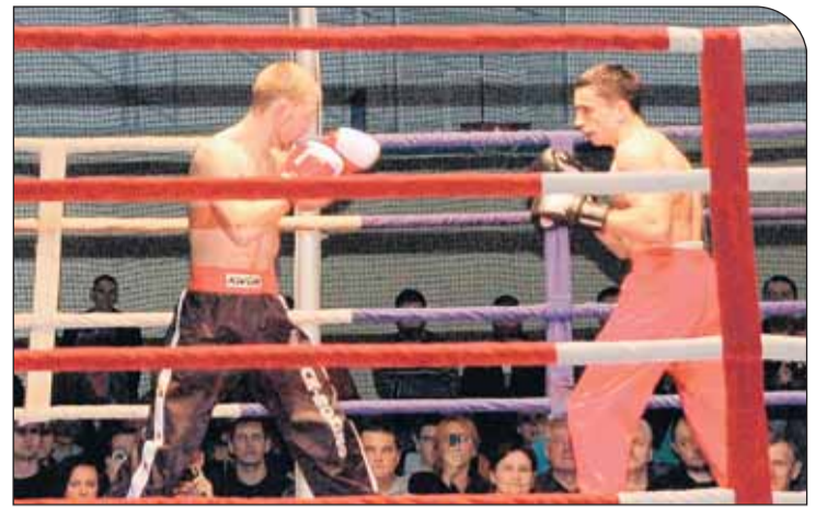
Zmagania w ringu